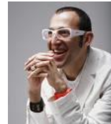
Karim Rashid (Designer)

“Austria has a unique position on the world map. Creatively and physically it is right in the middle, between the poetry of Italian design, the engineering of German design and the upcoming new creativity in Eastern Europe.”